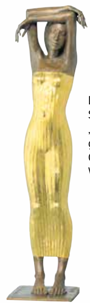
Die bronzene Skulptur „Die Träumende“ geht an die Gewinner des Wettbewerbes.

Weitere Informationen zum Wettbewerb unter: www.unternehmerpreis.de