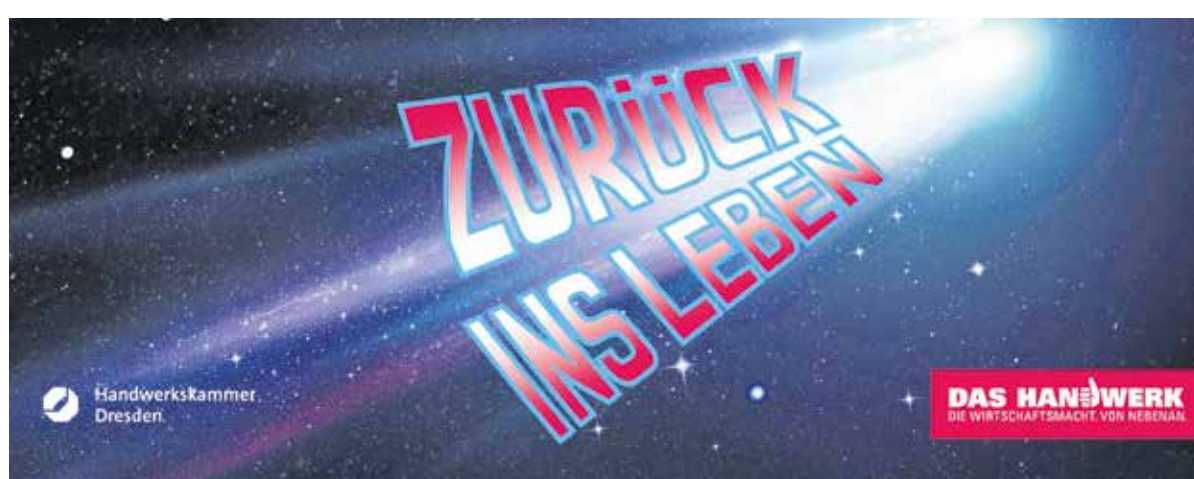
Zurück ins Leben: Das Jahr 2022 muss die Wende bringen. Daran will auch die Handwerkskammer Dresden mitwirken. Grafik: Handwerkskammer Dresden/Foto: James Thew/stock.adobe.com

für die bevorstehenden Monate lauten. „Das ost-sächsische Handwerk will endlich wieder beschleunigen. Dafür brauchen wir eine Politik des Fortschritts und des Ermöglichs und eine klare Fahrtrichtung“, betont daher auch Jörg Dittrich, Präsident der Handwerkskammer Dresden. In seinem Editorial zum Jahresauftakt nimmt er die neue Bundesregierung in Berlin, aber auch die sächsische Landesregierung in die Pflicht, die passenden Rahmenbedingungen zu setzen. Seite 7