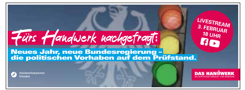
Grafik: Handwerkskammer Dresden

Lehrstellen-Hotline: Tel. 0351/4640-987, E-Mail: einfachmachen@hwk-dresden.de