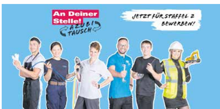
Für Azubi-Tausch Staffel 2 werden sechs Lehrlinge gesucht.